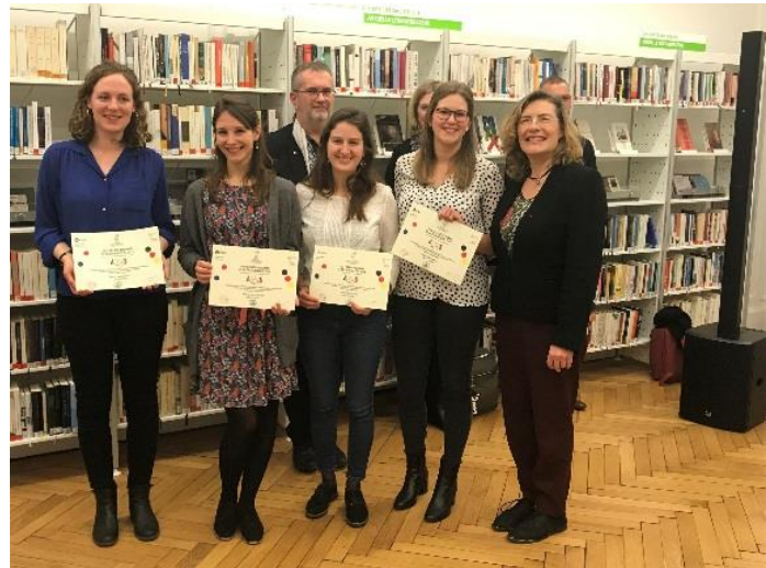
Prix franco-allemand de la chancellerie (54)