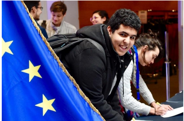
Mois de l'Europe à Strasbourg