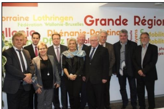
Assemblée générale Generalversammlung 15.11.2016, Esch-sur-Alzette