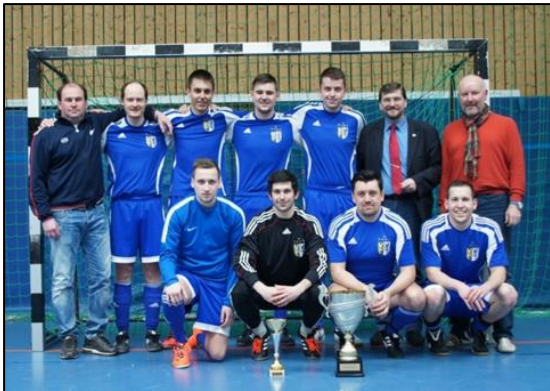
Tournoi de football Fußballturnier 18.03.2016, Birkenfeld