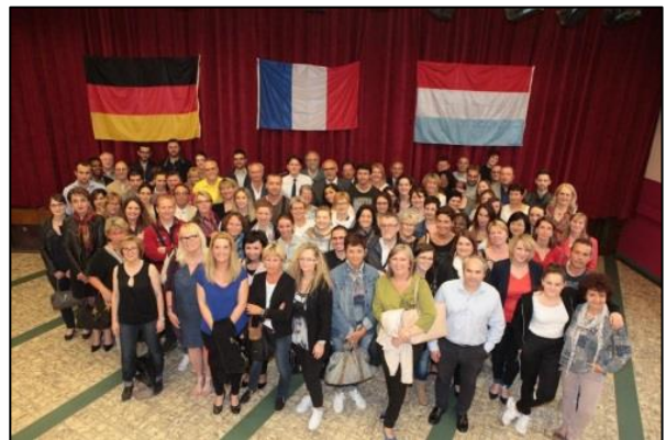
Remise des certificats de luxembourgeois Verleihung des Abschlusszertifikates in Luxemburgisch 04.07.2016, Yutz