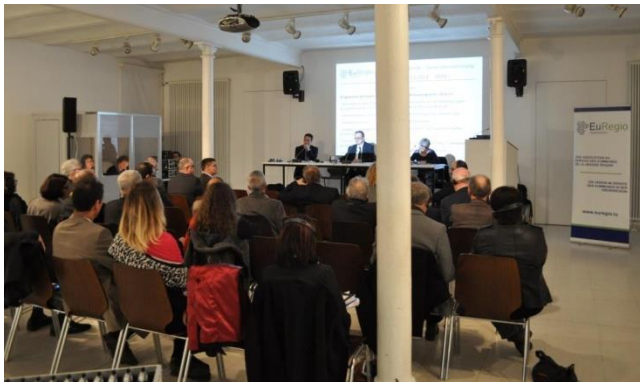
Remise des certificats de luxembourgeois (07.07.2014, Hettange-Grande)