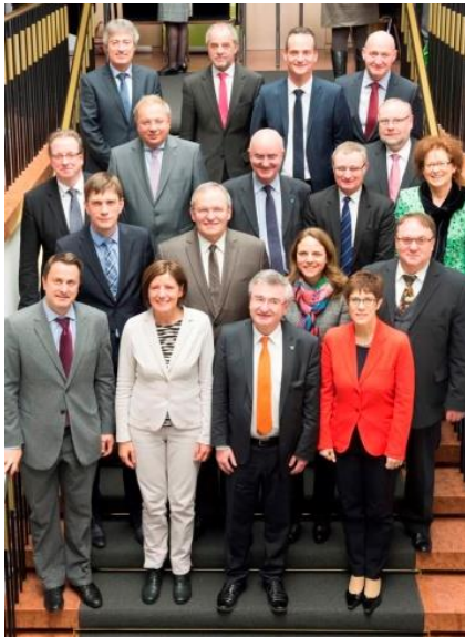
Signature de l'accord-cadre sur la formation professionnelle transfrontalière (05.11.2014, Trèves)