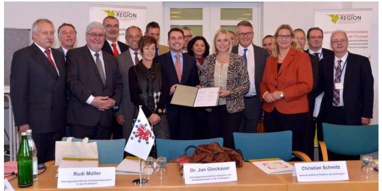
Assemblée générale (27.11.2014, Trèves)