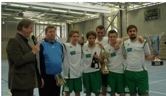
13/04/12, Saarbrücken 11 ème tournoi – 11. Turnier