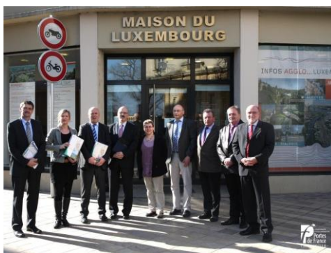
01/03/12, Thionville Une délégation de Trèves à la Maison du Luxembourg Eine Delegation aus Trier im Haus von Luxemburg