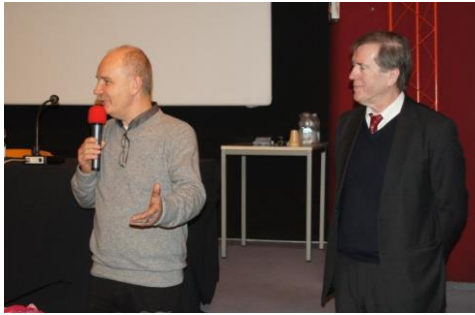
15-16/02/13, Nancy 9 ème journée jeunesse – 9. Fachtagung Jugend