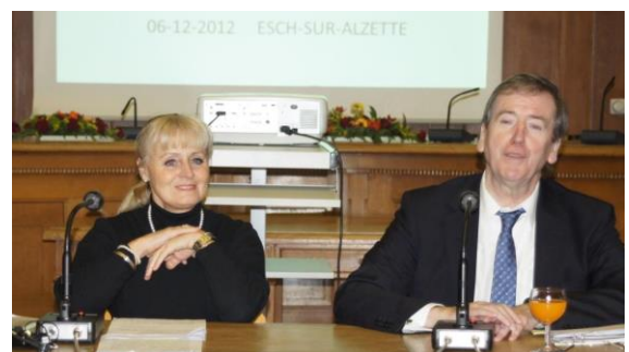
06/02/12, Esch/Alzette Assemblée générale – Generalversammlung